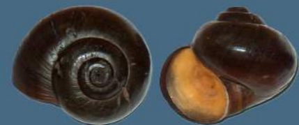
Lanistes (Ej: L. varicus )