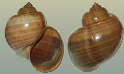
Pomacea (Ej: P. canaliculata )