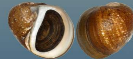
Pomella (Ej: P. megastoma )