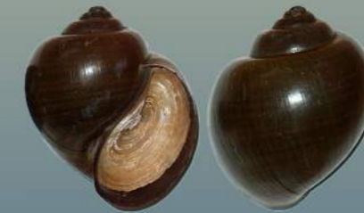
Pila (Ej: P. africana )