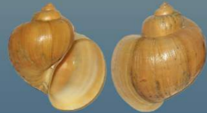
(Ej: Pomacea bridgesii )