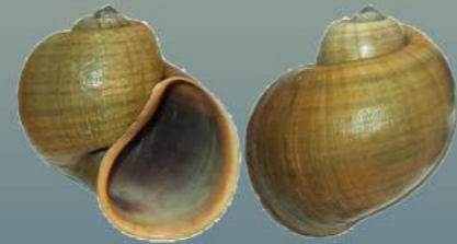
(Ej: Pomacea insularum )