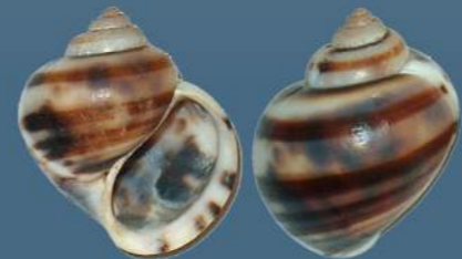
Asolene (Ej: A. pulchella )