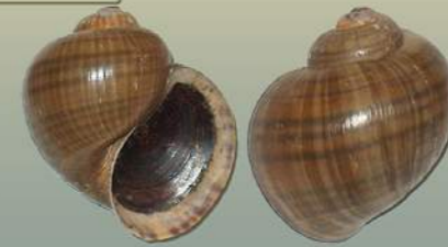
Ampullaria (Ej: A. figulinus )